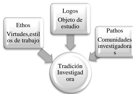
Figura 1: Tradición investigadora

Tales prácticas se formulan alrededor de una cultura, puesto que son resultado de una construcción social relacionada con las condiciones intelectuales, materiales, sociales y espirituales que dominan un espacio y un tiempo; de acuerdo con Bourdieu (2003) y Clark (1991), las culturas se expresan en significados, valores, costumbres, rituales, instituciones,